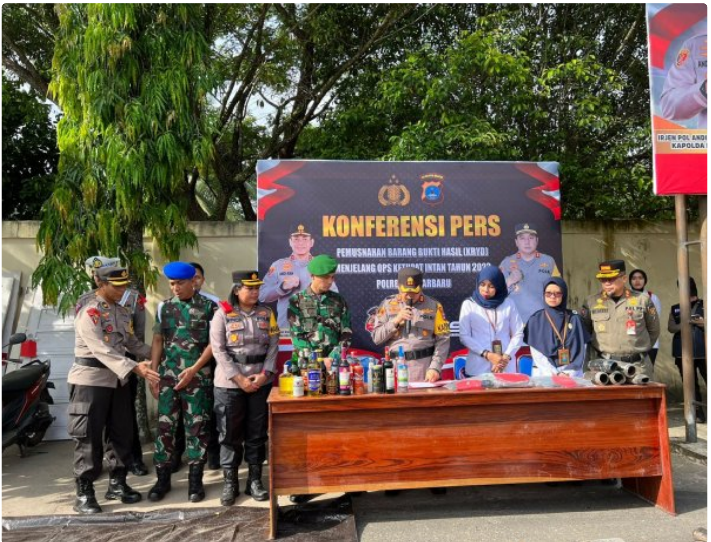
Kapolres Banjarbaru Bersama Dandim Banjar Musnahkan Ribuan Miras dan Ratusan Knalpot Brong di Kota

BANJARBARU - Ribuan minuman keras (miras) dan ratusan knalpot brong dari